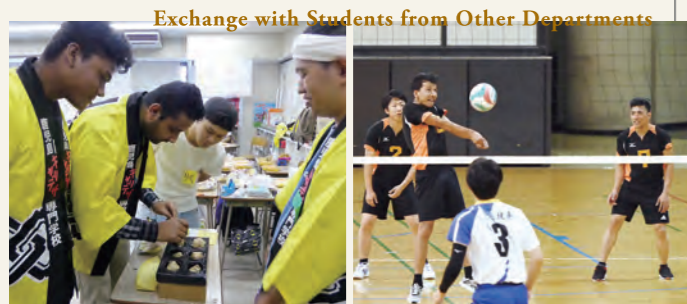
Exchange with Students from Other Departments