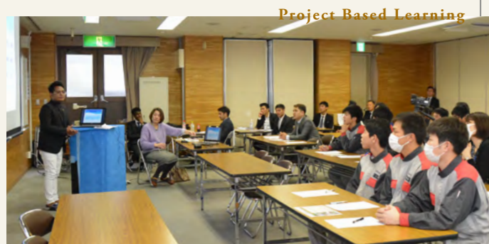
Project Based Learning

本校日本語科，不僅是學習日語的學校。 本校是一所重視為了實現「您想要做的事」而培養學子能使用日語與「社會生活能力」的學校。為此，本校全力以赴地提供各種支援。我們也很珍視您目前所具備的個性，同時透過學習日語，一起陪伴您探索發現全新的自我！